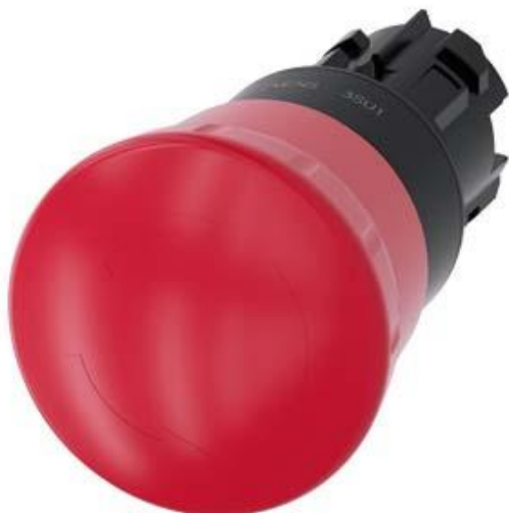
Figure à titre d'exemple

bouton-poussoir coup de poing d'arrêt d'urgence, 22 mm, rond, plastique, rouge, 40 mm, Manœuvre positive d'ouverture à 2 contacts NF, selon EN ISO 13850, Déverrouillage par rotation